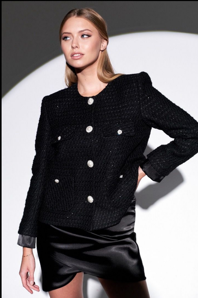
DRESS BY STESHA moscow