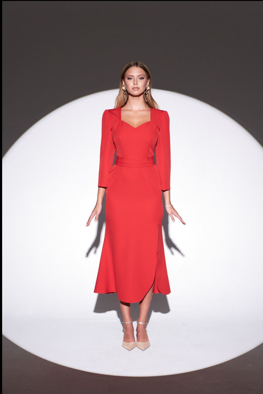
DRESS BY STESHA moscow