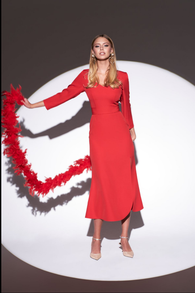
DRESS BY STESHA moscow